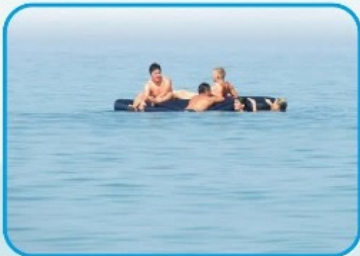
НЕ ДОВЕРЯЙТЕ НАДУВНЫМ МАТРАСАМ