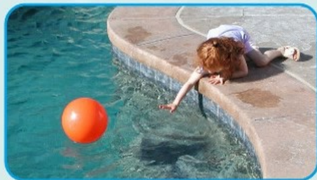
НЕ ОСТАВЛЯЙТЕ ДЕТЕЙ БЕЗ ПРИСМОТРА