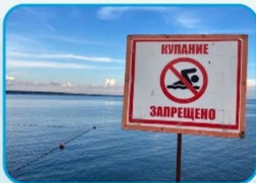
ТЫЙЫМ САЛЫНҒАН ОРЫНДАРДА СУҒА ТҮСУГЕ БОЛМАЙДЫ