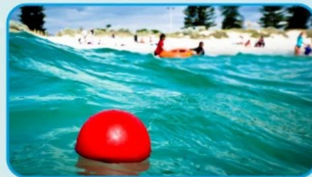
НЕ ЗАПЛЫВАЙТЕ ЗА УСТАНОВЛЕННЫЕ БУЙКИ