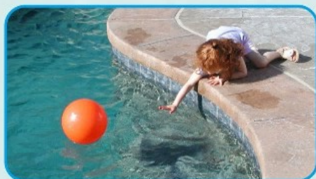
БАЛАЛАРДЫ ҚАРАУСЫЗ ҚАЛДЫРМАҢЫЗ