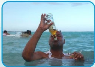
НЕ КУПАЙТЕСЬ В НЕТРЕЗВОМ СОСТОЯНИИ