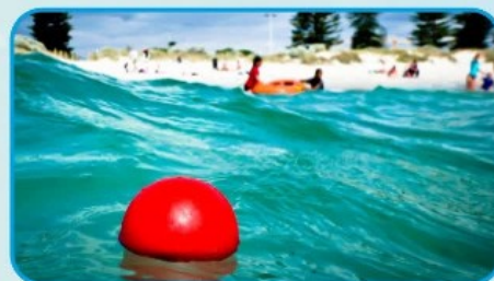
ОРНАТЫЛҒАН ҚАЛТҚЫДАН АСУҒА БОЛМАЙДЫ