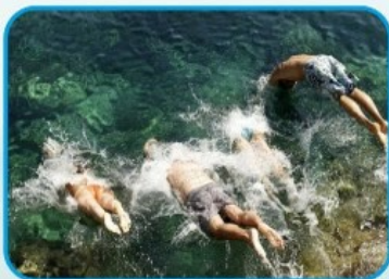
ӨЗІҢІЗДІ ҮНЕМІ БАҚЫЛАУДА ҰСТАУДЫ ҰМЫТПАҢЫЗ