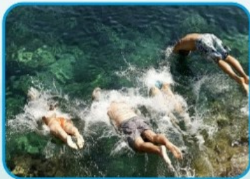
НЕ ЗАБЫВАЙТЕ О САМОКОНТРОЛЕ