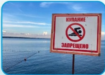
НЕ КУПАЙТЕСЬ В ЗАПРЕЩЕННЫХ МЕСТАХ