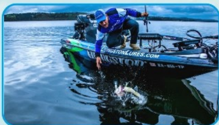
ҚАЙЫҚТЫҢ ЕРНЕУІ МЕН ТҰМСЫҒЫНА ОТЫРУҒА БОЛМАЙДЫ