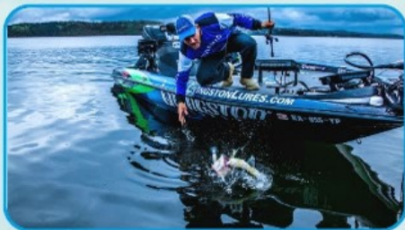
ЗАПРЕЩАЕТСЯ СИДЕТЬ НА БОРТАХ И НОСОВОМ ОТСЕКЕ ЛОДКИ