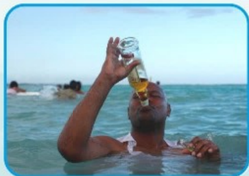
МАС КҮЙДЕ СУҒА ШОМЫЛМАҢЫЗ